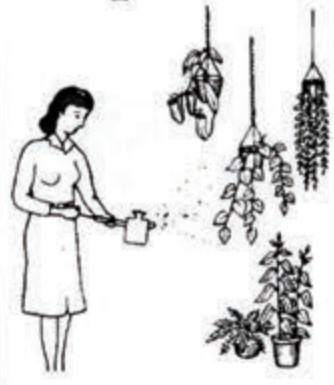
シリンジ(薬水)のやり方